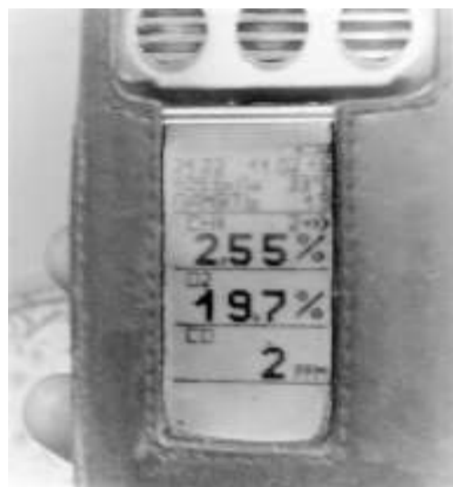
Индивидуальный прибор, который показывали рабочие шахты «Северная», после трагедии – мол вот в каких условиях мы работали.